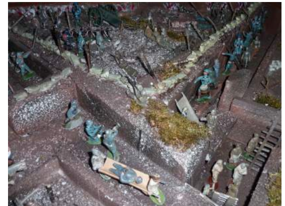
Reconstitution d'une tranchée