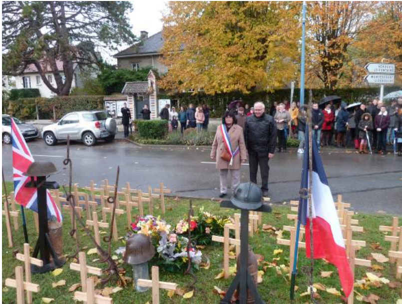
Dépôt de gerbes au Monument aux Morts