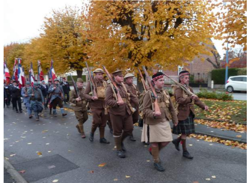
LES « TOMMIES » et LES « POILUS »