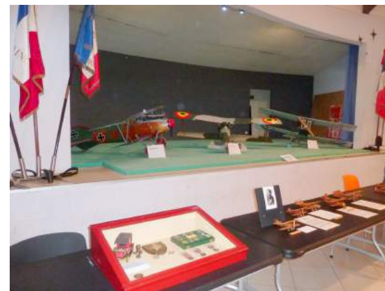
Avions Modèles Réduits et maquettes