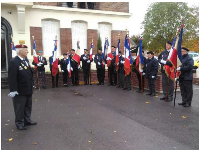
L'ensemble des Porte-drapeaux