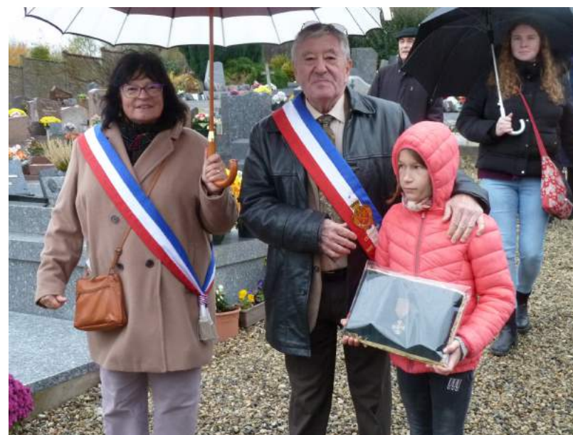
La Commune a la Croix de Guerre depuis 1922

« Ma chère Edith, ici la vie est très dure, dans les tranchées l'odeur de la mort règne. Les rats nous envahissent, les parasites nous rongent la peau. Nous vivons dans la boue... »