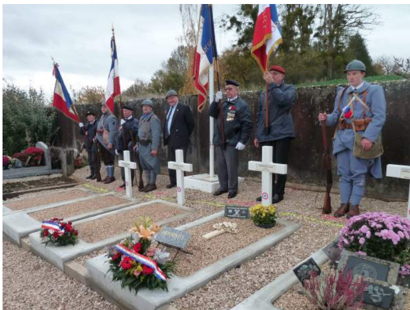
Hommage aux soldats français