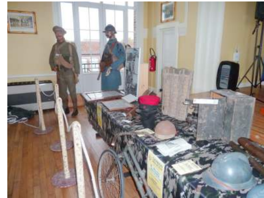
Matériel militaire de la 1ère Guerre Mondiale