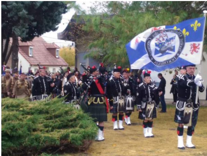
LES CORNEMUSES D'HOMBLEUX