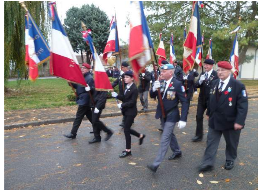
LES PORTES DRAPEAUX DE L'UNC