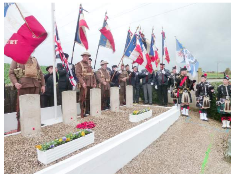
Hommage aux soldats britanniques