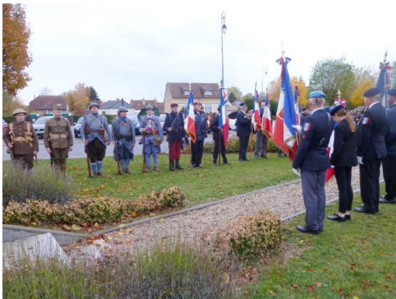
Cérémonie à la stèle des régiments anglais