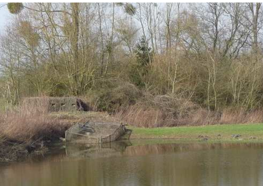
Le Moÿ Quand remercie toutes les personnes qui ont collaboré à l'élaboration de l'article sur les huttes.