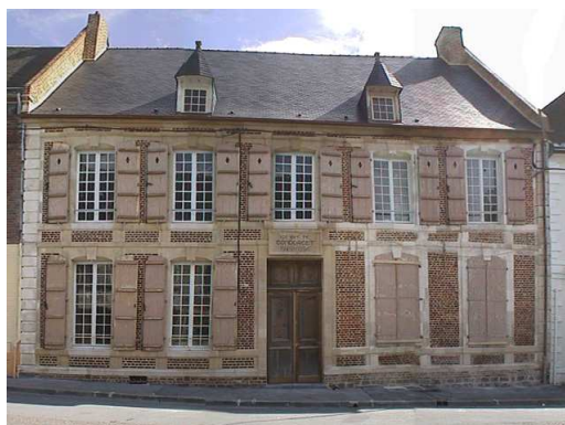
Maison natale de Condorcet à Ribemont

Elu à l'assemblée législative en Septembre 1791, il est réélu en 1792 à la convention nationale par le département de l'Aisne.