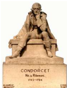
Statue à Ribemont

Mais dès que Condorcet apprend qu'un décret a été publié condamnant à mort toute personne cachant un proscrit, il décide de partir. Il est arrêté puis emprisonné à Bourg la Reine. On le retrouve mort dans son cachot le 29 Mars 1794. Suicide ou épuisement? On ne le saura jamais.