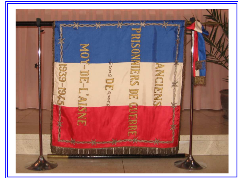
Le Drapeau de Moy de l' Aisne

Tout ce que vous voulez savoir sur votre village