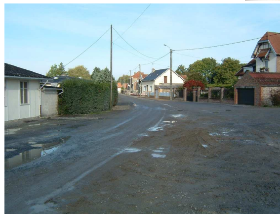
La rue Camille Desmoulins